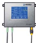
Optidew 501 Hygromètre à miroir refroidi