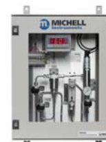
ES20 Systèmes d'Échantillonnage

Michell Instruments a adopté un programme de développement durable Publication n° : MDM300_97156_V9.5_FR_0223