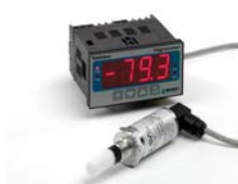
Easidew Online Hygromètre à Point de Rosée