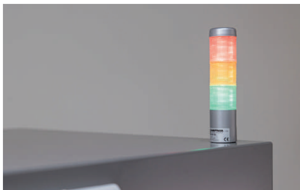
Témoin en détail