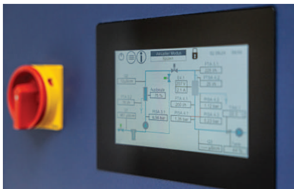
Écran facile à utiliser