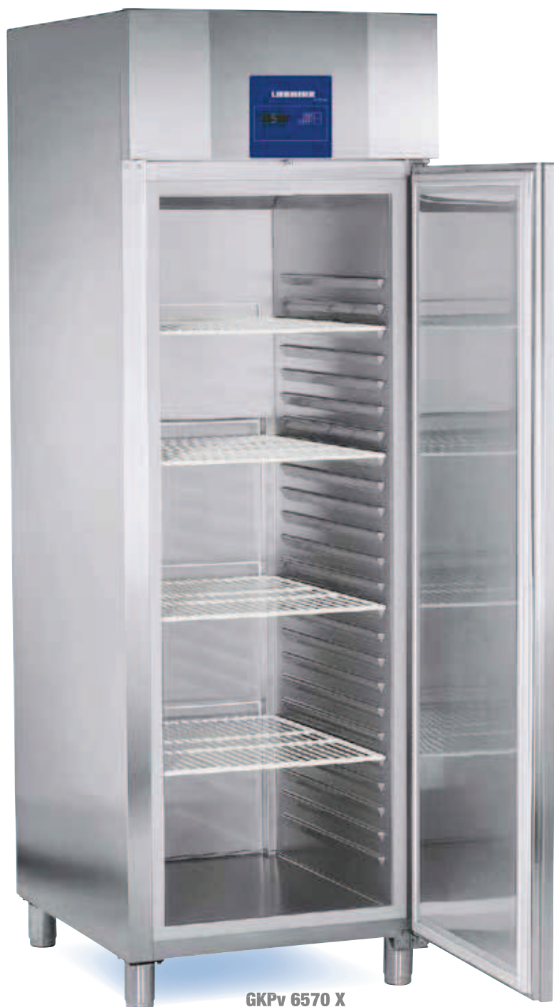
GKpv 6570 X