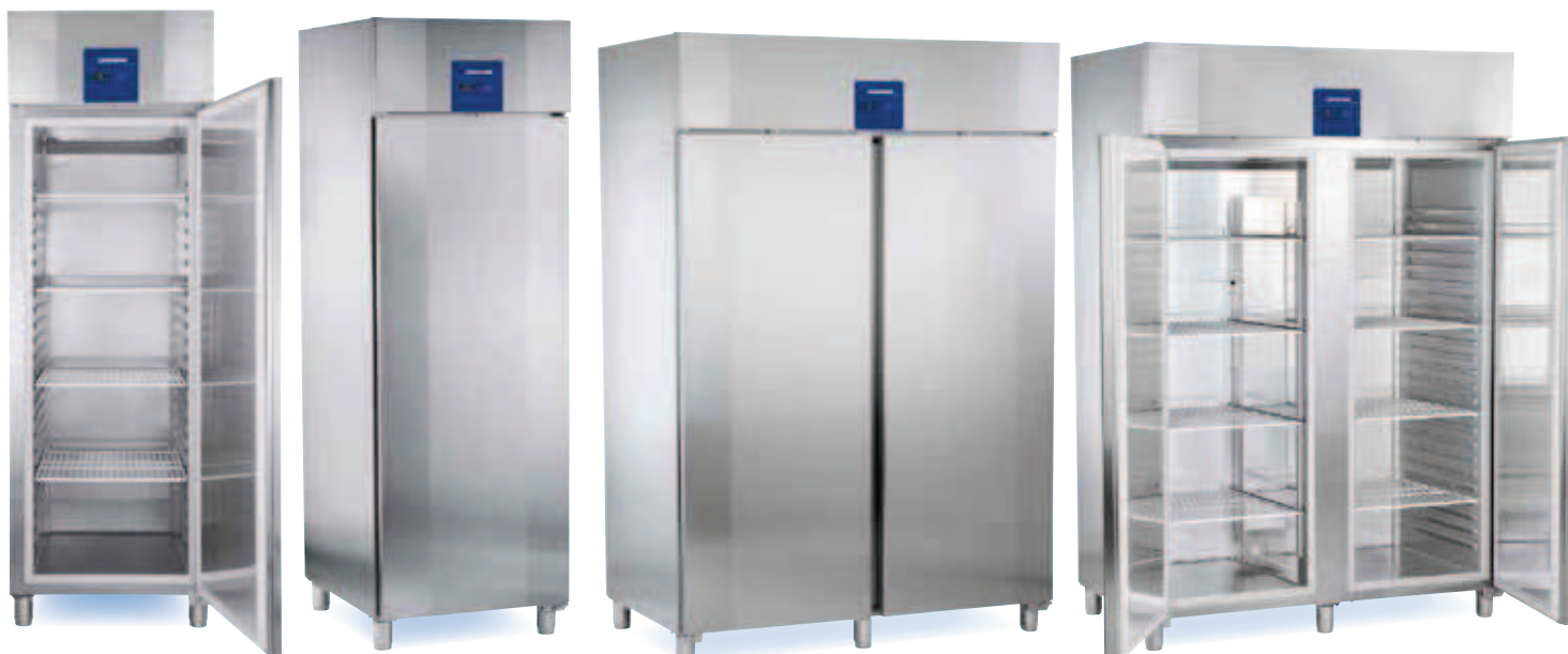
GKPv 6570 X positif