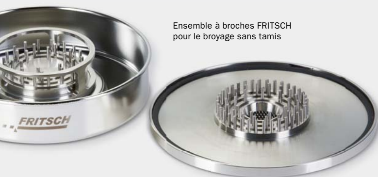
Ensemble à broches FRITSCH pour le broyage sans tamis

Encore un conseil : pour le broyage d'échantillons sensibles à la température, le kit pour grandes quantités avec le grand sac nylon assure un débit d'air plus élevé et donc un meilleur refroidissement.