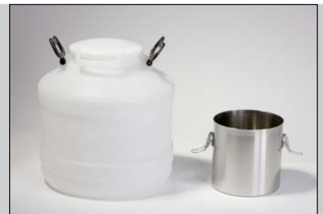
Récipient collecteur de grande contenance 30 l, récipient collecteur de petite contenance 5 l