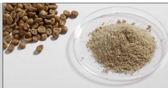
Café brut avant et après le broyage avec la P-14 à 20 000 tours /min et un tamis à passages trapézoïdaux de 1 mm