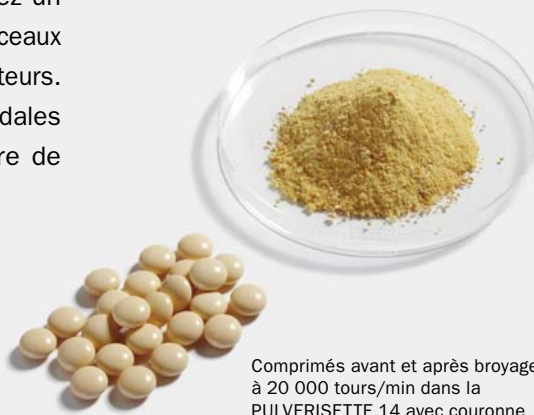
Comprimés avant et après broyage à 20 000 tours/min dans la PULVERISETTE 14 avec couronne de broyage et tamis à perforations trapézoïdales de 2 mm

Pour la préparation d'échantillons dans le cadre de la directive RoHS (détermination de la teneur en chrome hexavalent, etc.), vous équipez la PULVERISETTE 14 avec un rotor à 12 batteurs plus un tamis annulaire à trous trapézoïdaux, tous deux pourvus d'un revêtement en carbure de tungstène.