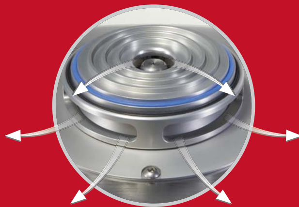
Circulation d'air très étudiée pour un refroidissement efficace de l'échantillon

Vous ne trouverez cela que chez FRITSCH : la circulation d'air dans la PULVERISETTE 14 assure un flux d'air continu sur le rotor, sur le moteur et les outils d'entraînement ainsi que le refroidissement du broyat dans le récipient collecteur. D'autre part un ventilateur de fort débit assure un soufflage d'air frais dans l'appareil, l'air passant par un filtre de retenue des particules. Ce ventilateur crée une surpression et empêche ainsi l'introduction de poussières à l'intérieur.